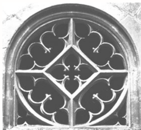
Abbaye d'Hauterive (CH-1725 Posieux) Rosaces du cloître XIVe siècle